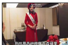
到世界各地推廣青森蘋果