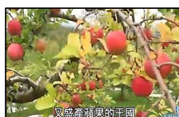
又盛產蘋果的王国