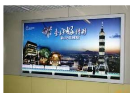
MRT デジタルサイネージ