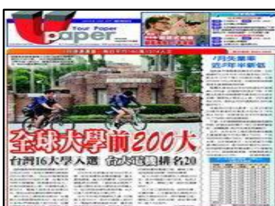
フリーペーパー(イメージ)