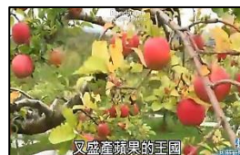
又盛產蘋果的王國