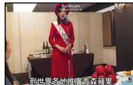
到世界各地推廣青森蘋果